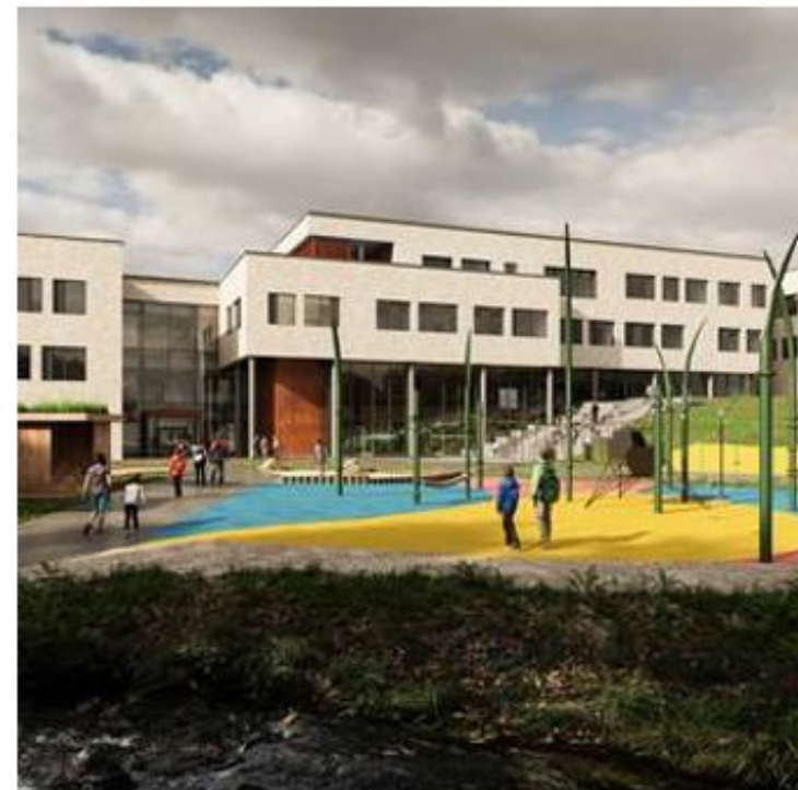
Slik ser skolen min ut.