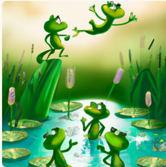
Frosken som ikke kunne hoppe